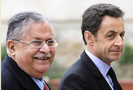
Frankrikes president Nicolas Sarkozy (t.h.) sammen med Jalal al-Talabani, president i Irak.